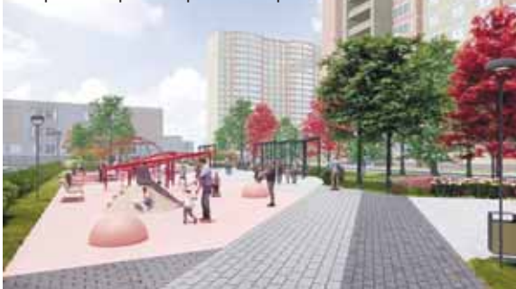
Сквер в п. Октябрьский откроют в сентябре

– Мы, жители дома № 24 по ул. 2-я Заводская в Красково, выражаем благодарность за заботу руководителям муниципалитета. Вокруг нашего дома уложен новый асфальт. Теперь дети могут безопасно кататься на самокатах и велосипедах, наши пожилые родители не спотыкаются, гуляя вокруг дома. И со своей стороны, мы ждем обновления детской площадки около нашего дома.