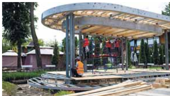
Такой будет смотровая площадка в Наташинском парке

– Когда все работы будут завершены, наш Наташинский парк преобразится до неузнаваемости. Здесь появятся смотровая площадка, лодочная станция, вело- и беговые дорожки, полноценная спортивная локация с тренажерами и даже экстрим-зона с памп-треком. Открытие обновленного парка запланировано осенью этого года.