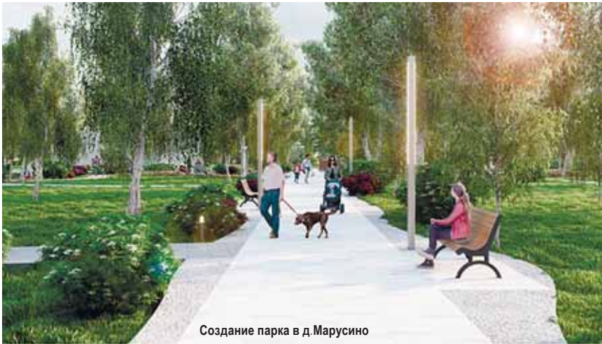
Создание парка в д. Марусино

грунта и устройству корыта для пешеходных дорожек, установки закладных деталей для опор освещения и прокладке подземных коммуникаций.