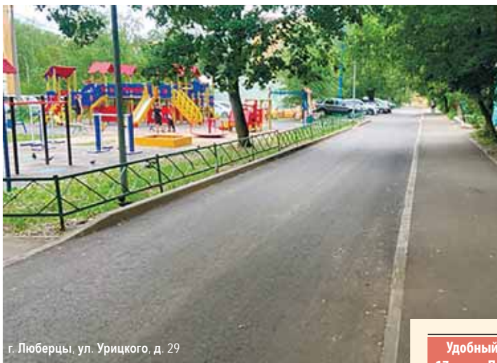
г. Люберцы, ул. Урицкого, д. 29