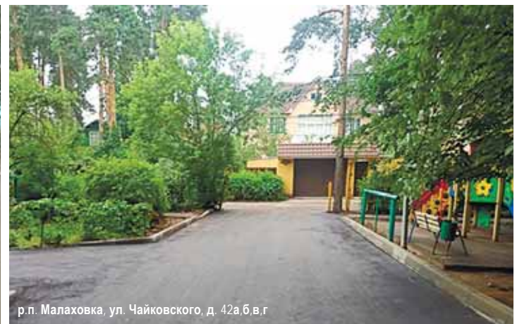
р.п. Малаховка, ул. Чайковского, д. 42а,б,в,г

Удобный тротуар для пешеходов сделали от дома 9 по Комсомольскому проспекту до дома 17 по ул. Побратимов