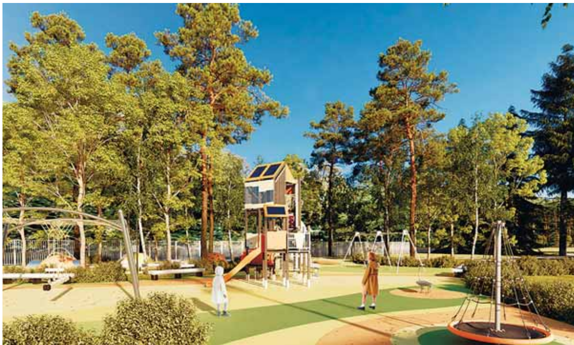
Реконструкция ПКИО «Летний парк» в п. Малаховка

На спортивной зоне по просьбам молодого и активного поколения запланирован памп-трек, а также площадка не только для игры в волейбол, баскетбол и мини-футбол, но и в зимний период для катания на коньках. На встречах с жителями эта идея нашла большой отклик у малаховцев.