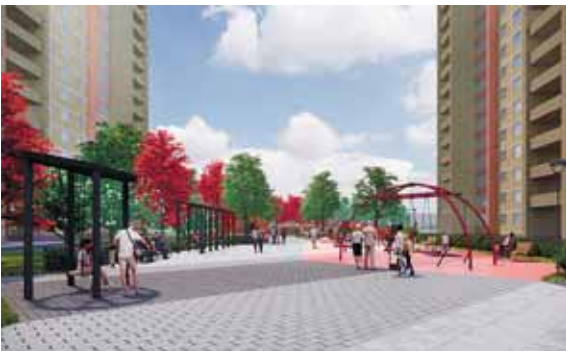
Реконструкция сквера в р.п. Октябрьский

Для активных школьников и спортивных жителей Красково предусмотрен интересный маршрут на площади перед гимназией. А неповторимый индивидуальный образ скверу придадут звезды даже на асфальте.