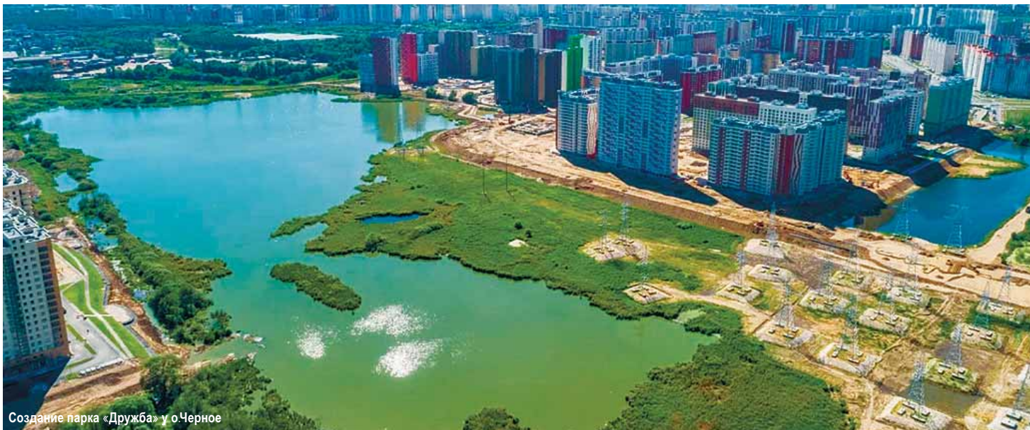
Создание парка «Дружба» у о.Черное