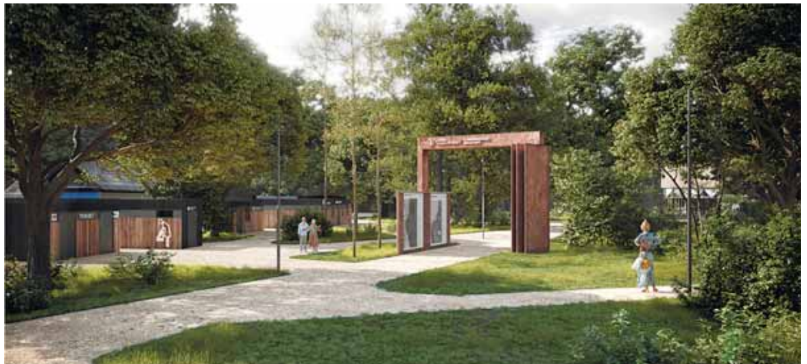
Томилинский лесопарк вблизи Большого Люберецкого Карьера

Ввиду непосредственной близости Томилинского лесопарка к жилому массиву го Дзержинский, мы посетили необходимым пригласить к обсуждению жителей Дзержинского. Так 30.05.2024 года на поляне в ле-