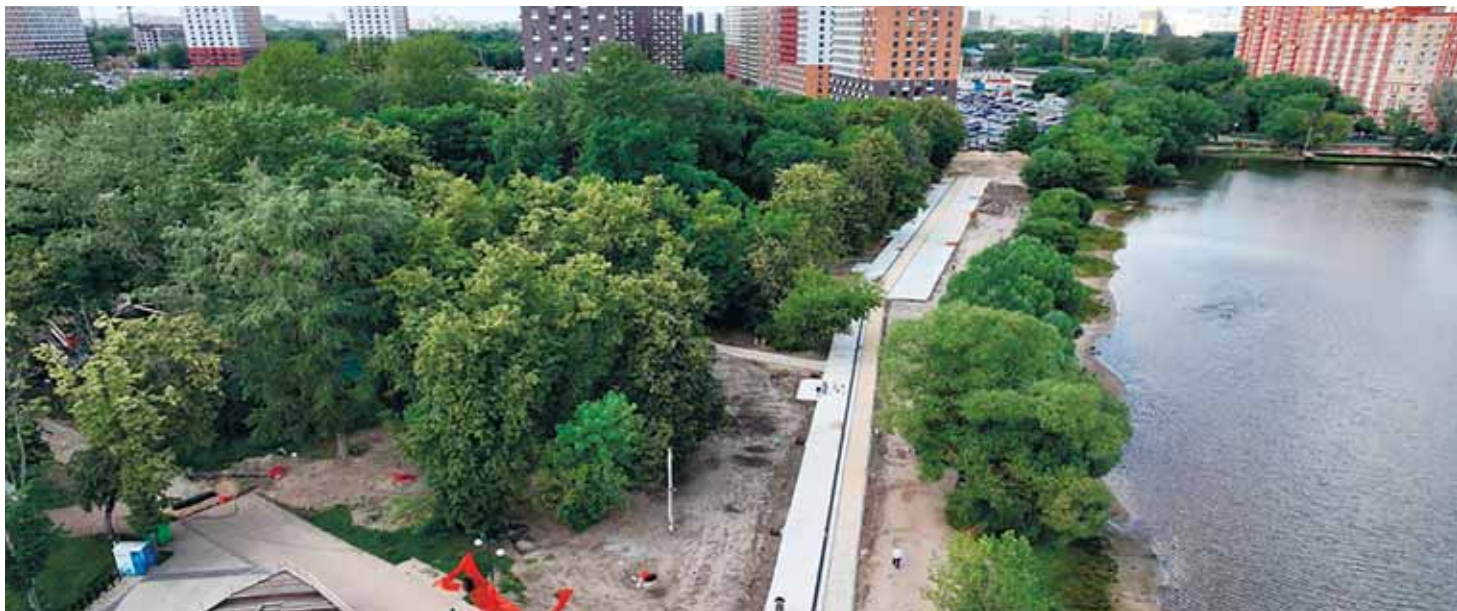
Реконструкция ПКИО «Наташинский парк»