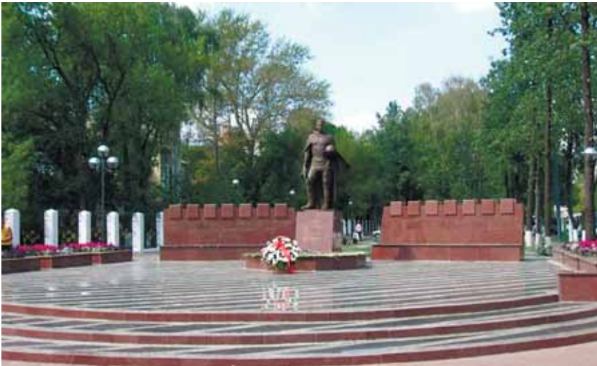
Мемориал «Вечный огонь» Октябрьский пр-кт, д.116

Сквер у памятника «Вечный огонь» стал победителем в 2023 году Федерального проекта ФКГС национального проекта «Жилье и городская среда». Более того, следующий год – юбилейный год. 80 лет Великой победы над фашистской Германией.