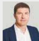
Владимир ВОЛКОВ, глава городского округа Люберецы:

«Парк «Дружбы расположен на границе микрорайона «Некрасовка» (г. Москва) и городского округа Люберецы. Со стороны нашего округа будут проведены работы по обустройству двух платформ на буронабивных сваях. Также будет построен пешеходный мост Дружбы между московским и люберецким берегами, расчищена акватория озера, установлены опоры освещения и система видеонаблюдения».