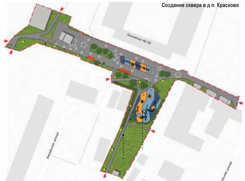
Создание сквера в д.п. Красково