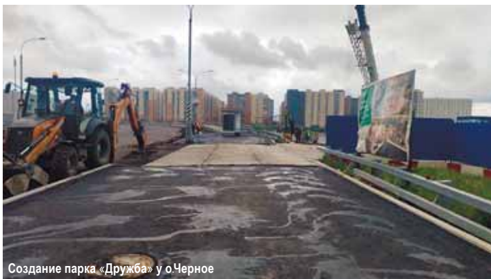
Создание парка «Дружба» у о.Черное