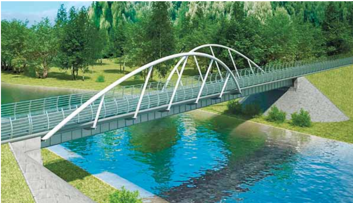
Мост через р. Македонка на Малаховском озере

и, конечно, постарались предусмотреть и для наших молодых, и возможно в будущем великих спортсменов достойные условия для тренировок и соревнований, поэтому в лесопарке запланирован павильон для проката инвентаря и возможности выпить горячего чая или воды, трибуны для болельщиков и зон старта и финиша.