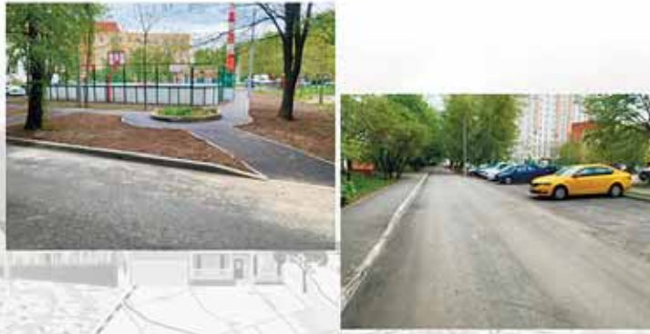
КБДТ: г. Люберцы, ул. Попова, д.24/1 - ул. Побратимов, д.11